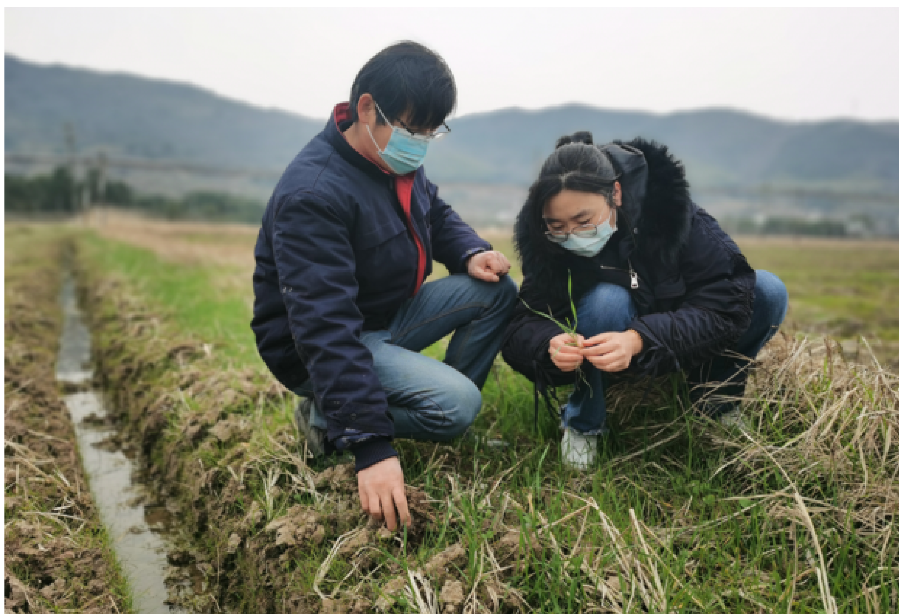
农技人员深入田间地头指导农户

农技专家还注重加强对小麦、油菜等春花作物的田间管理。当天,农技专家来到定海区爱庆农机专业合作社,查看50亩油菜长势。